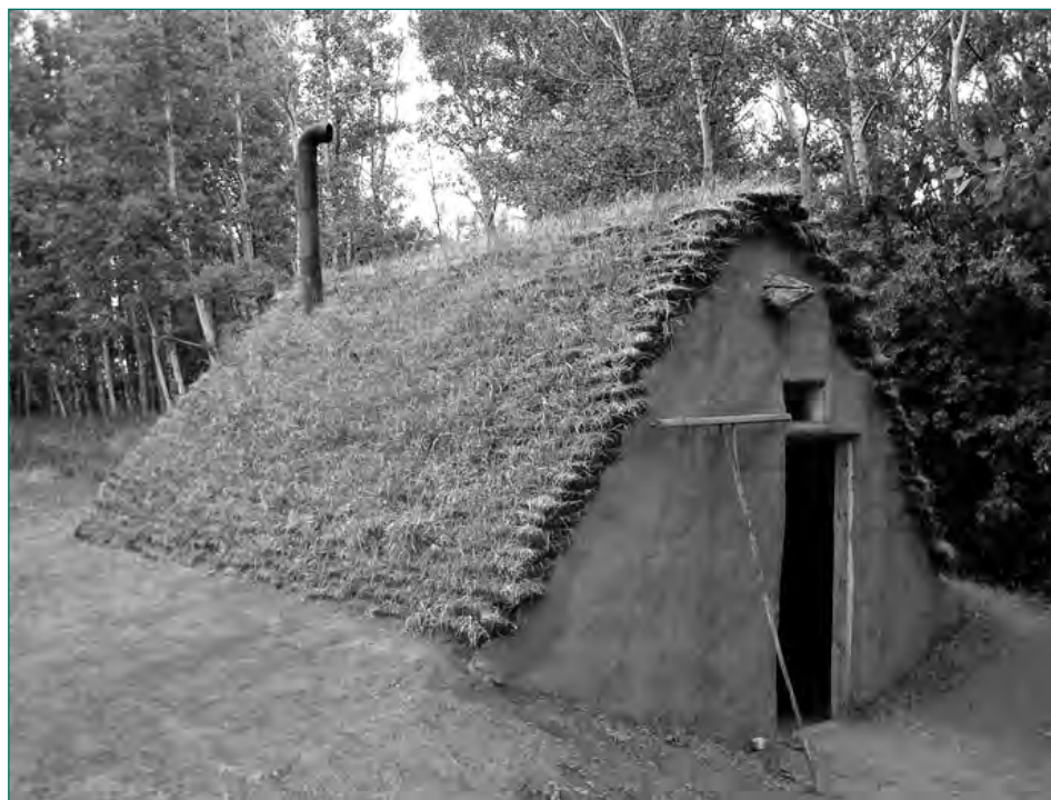
Реконструкція напівземлянки, в якій проживали українські емігранти в кінці 1890-х років (екомузеї Калина-Кантрі поблизу Едмонтона, Альберта).

Заможний фермер Василь Єлиняк, з яким Пилипів більшу частину свого емігрантського життя не спілкувався через розбіжності у питаннях релігії, як один з перших емігрантів 3 січня 1947 року став почесним громадянином Канади і помер у віці 92-х років 12 січня 1956 року у місті Чіпмен, провінція Альберта. У його родині було семеро дітей, 51 онук та 62 правнуки і правнучки, одна з яких—Еріка Еленьяк—стала всесвітньо відомою як зірка журналу «Playboy» і кіносеріалу «Рятівники Малібу».